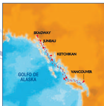
--- GLACIAR BAY

Disfrute de todas las maravillas naturales de esta Gran Tierra desde el Pasaje Interno. CARNIVAL SPIRIT tiene más balcones privados para disfrutar la belleza intacta que cualquier otro barco que navega por Alaska. Sólo la variedad de emocionantes espacios públicos del CARNIVAL SPIRIT y el paseo circular al aire libre le garantizará la mejor vista posible que pueda tener del increíble viaje a través del Pasaje Interno y a lo largo del Golfo de Alaska. No existe mejor manera de ver los esplendores de Alaska que en un crucero de Carnival. ¡Venga a ver la Joya de la Corona Estadounidense!