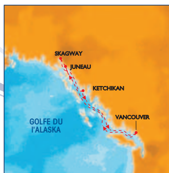
--- GLACIER BAY