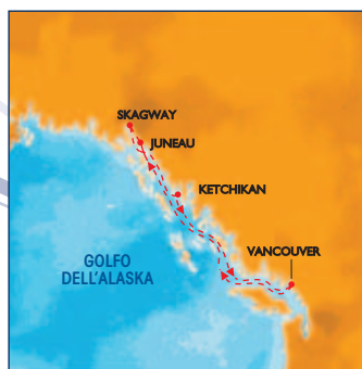
--- BAIA DEI GHIACCI